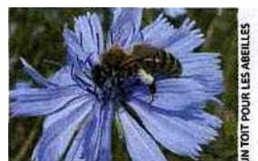
UN TOIT POUR LES ABEILLES

→ Tél. : 05 17 26 10 23 ; www.untoitpourlesabeilles.fr